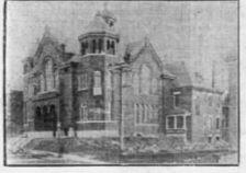
Das Gebäude der...